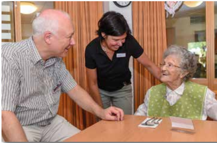
Kleiner Plausch in der Gemeinschaftsküche: